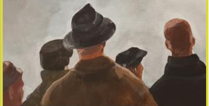
Kunsthuis DORP 16 – Zevergem (De Pinte aan de Schelde ©) www.kunsthuisdorp16.be

Stuur uw mailadres door via de site en wij houden u op de hoogte van de expo's.